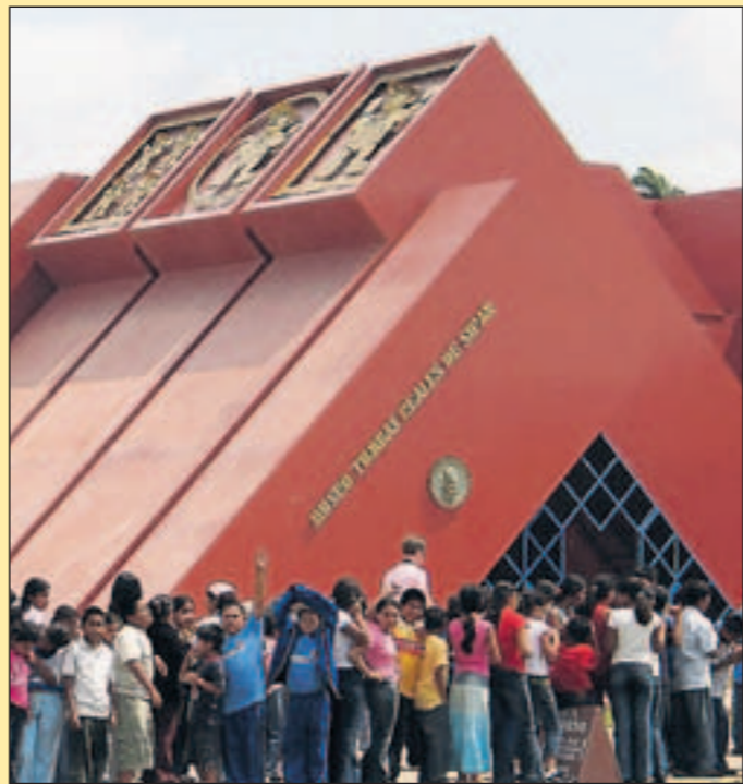
2. Tag Eine Schulklasse wartet vor dem schönsten Museumsbau Südamerikas, dem archäologischen Museum von Chiclayo – gebaut wie eine Königs-Pyramide im nahe gelegenen Sipan.