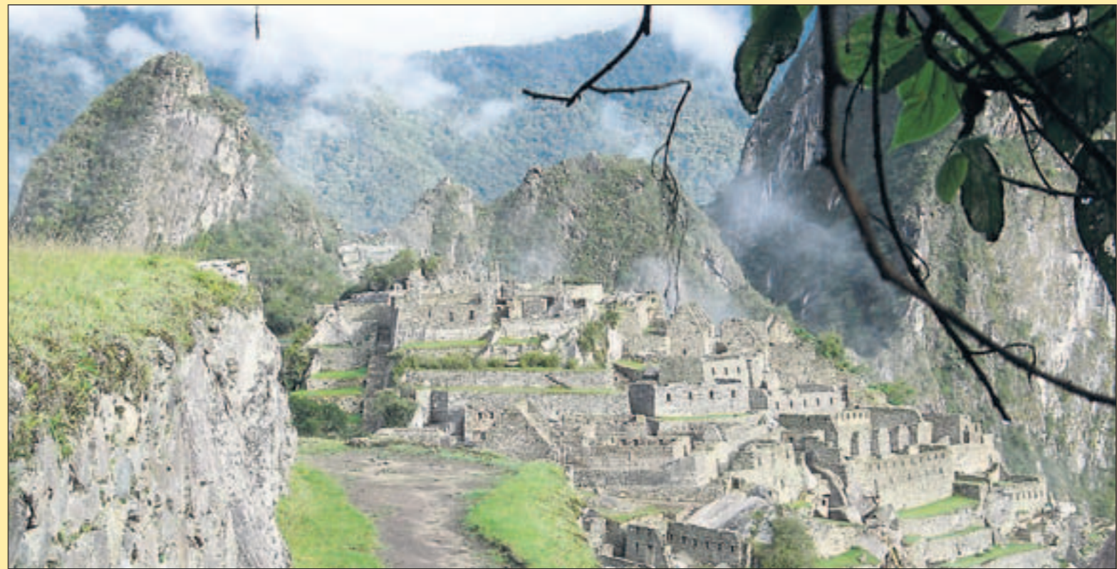
9. Tag Kein Ort in Südamerika zieht mehr Touristen an wie Machu Picchu. Mehr als eine halbe Million im Jahr fährt in die heilige Stadt der Inka auf den Berg. Am schönsten – und ruhigsten – ist der Ort am frühen Morgen, wenn die Sonne aufgeht und die Nebel noch in den Bergen hängen.

Der 7. Tag: Cusco Flug nach Cusco: Die Stadt ist schwindelerregend – nicht nur wegen der Höhe von 3 400 Metern, die einen in Zeitlupe gehen und den Kopf pochen lässt. Cusco, einst Hauptstadt des Inka-Reichs, dürfte eine der schönsten Städte des Kontinents sein; sie zeigt die Pracht der Inkas ebenso wie die der spanischen Eroberer, die allein in der Kathedrale sechs Tonnen Silber verarbeiteten und die Schnitzereien aus Zedernholz vergoldeten.