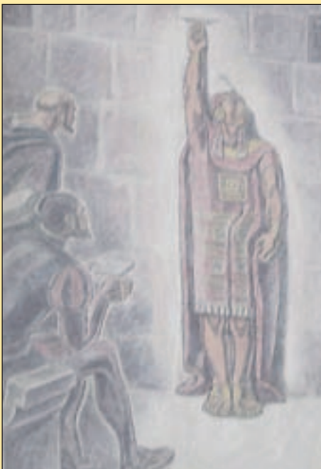
4. Tag Der letzte Inka-Herrscher Atahualpa auf einem modernen Gemälde: Mit dem ausgestreckten Arm zeigt er an, wie hoch das Gold zu stapeln ist, das er den Spaniern für seine Freilassung verspricht.