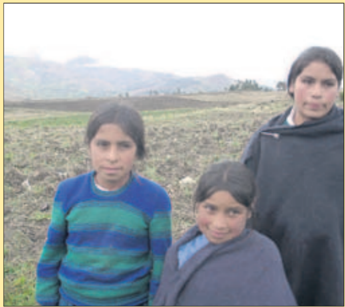
6. Tag Die Kinder einer Bauernfamilie im kalten Hochland, nur zu erreichen nach einer abenteuerlichen Schlaglöcher- und Serpentina-Fahrt. Sie wachsen auf ohne elektrisches Licht und Fernsehen, ohne Telefon und warme Dusche; zur Schule gehen sie Fuß – eine Stunde lang den Berg hinab.