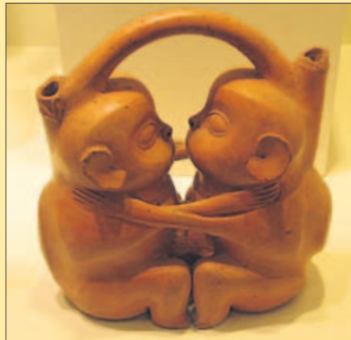
1. Tag Das erotische Kabinett im Larco Museum lehrt uns: Die alten Kulturen waren nicht gottgegeben lustlos. Die alten Peruaner genossen beides: Lust und Kultur.

Und wenn die Funken zischen, ist man sicher, den Teufel zu sehen.